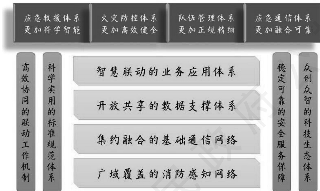
“数字消防”建设总体框架示意图

理精细化（详细任务见第七节“重大项目”项目六）。（责任单位和部门：各州、市人民政府；省消防救援总队，省发展改革委）